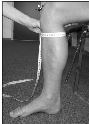
cD 2 cm under knæhase