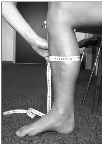
cC Bredeste sted på lægmuskel