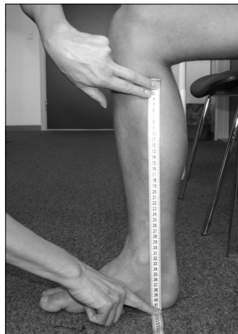
A-D Fra hæl kant til 2 cm under knæ